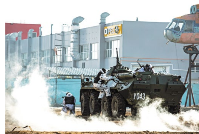
В России действуют 160 отрядов ОМОНа, где трудятся более 40 тысяч бойцов

мощи и подставят плечо. Кроме этого, мы проводим мероприятия на расширение кругозора: специалисты доводят оперативную информацию по миру, стране и городу; мы проводим дни