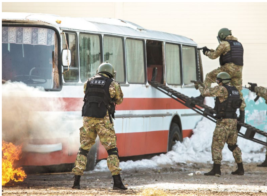
По словам командира сургутского ОМОН, для бойцов нет разницы, кто цель: мужчина, женщина, ребенок или пожилой человек. Важно, что это преступник

моментах сами митингующие, а вполне возможно и провокаторы, затесавшиеся в людскую массу, преследуя свои интересы, начинают действовать, выходя за рамки закона — кидать палки, камни, подходить к сотрудникам, которые не экипированы и просто преграждают путь к различным объектам. Тогда без физической силы и специальных средств не обойтись.