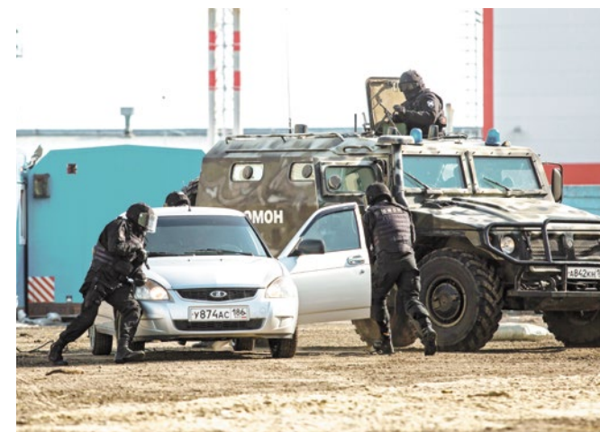
ОМОН существует с 3 октября 1988 года. Тогда МВД СССР издало приказ о создании специального подразделения

— Да, из героического подвига граждане, настроенные против правоохранительных органов, начали раздувать негатив.