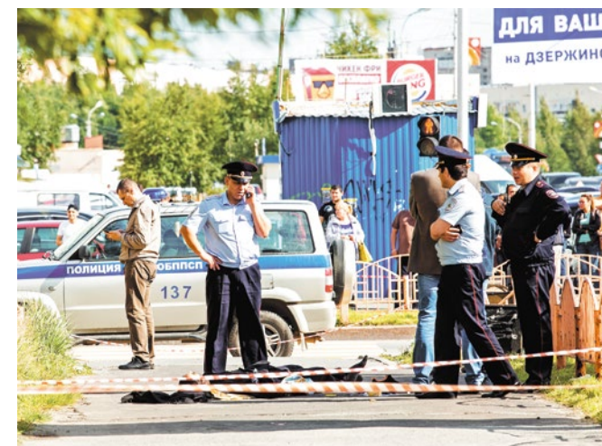
19 августа 2017 года от действий ножевого террориста пострадало семь человек. Преступник был застрелен во время погони. На нем находился муляж взрывного устройства

— Меня бы, скорее всего, не взяли на такую спецоперацию. До выезда проводят ряд работ, и меня бы исключили из штурмовой группы. Ну а вообще, если человек представляет реальную угрозу для граждан, то тут неважно, знакомый он мне или нет. Конечно, даже не хочется представлять подобного.