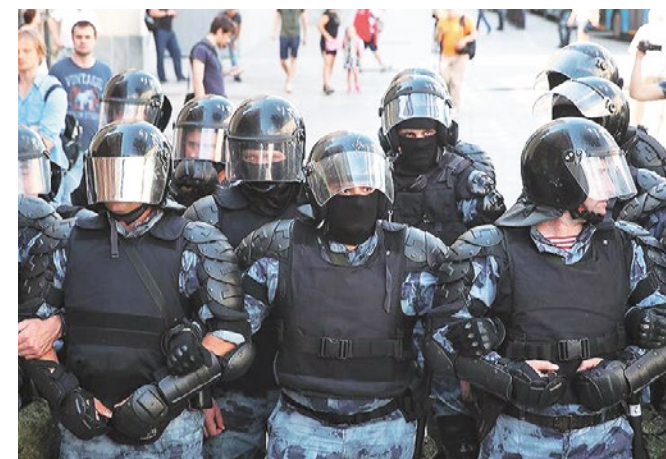
По данным ВЦИОМ, 69% россиян одобрили действия властей в отношении участников несанкционированной акции в Москве 27 июля